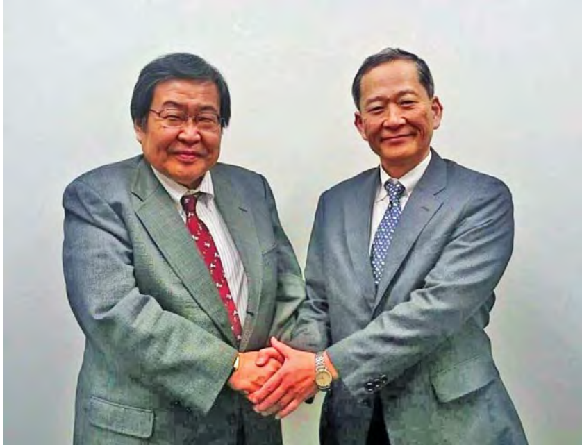
साइतोजि देब्रे र मिजुतानिजी दाहिने

उनको कार्यकालमा यो शिक्षा अझै फराकिलो हुन्छ भन्ने बिश्वास गरेको छु । सबैजना आफ्नो ख्याल राख्नु होला र हामी रहेसम्म यो धर्मलाई धेरै भन्दा धेरै मनिससम्म पुराउने कोसिस गरौ । अन्तमा फेरी एकपटक सबैजना धन्यवाद!