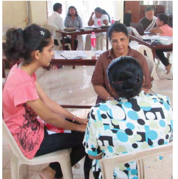
त्रिमनुस्य होजामा आफ्नो अनुभव भन्दै दयाजी (ठिक अघि)

अन्तमा बुवाआमा अनि श्रीमान तेसपछी छोराहरु जस्ले दुख सुख बाडे उनिहरुप्रती आभार व्यक्त गर्दछु । बुद्ध अनि सबैजना धेरै धन्यवाद ।