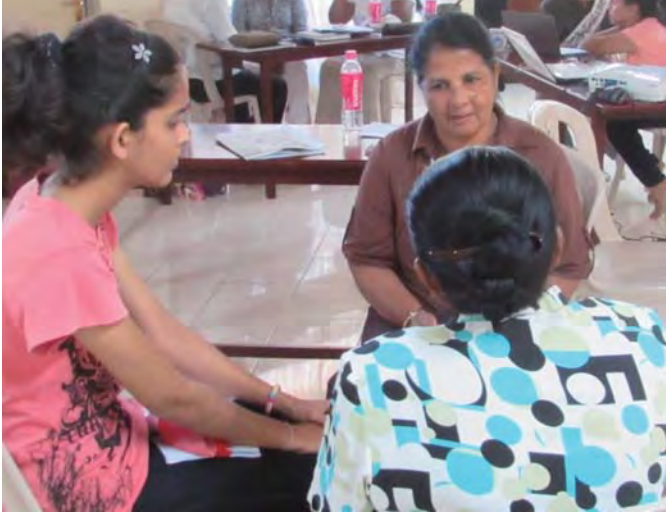
තුන් දෙනෙක් පමණක් සිට කරන හෝසාවේ, තම අදහස් ඉදිරිපත් කරන දයා මහත්මිය

බුදුරජාණන් වහන්සේටත්, අසා සිටි ඔබ සියළුදෙනාටත් බොහොම ස්තූතියි.