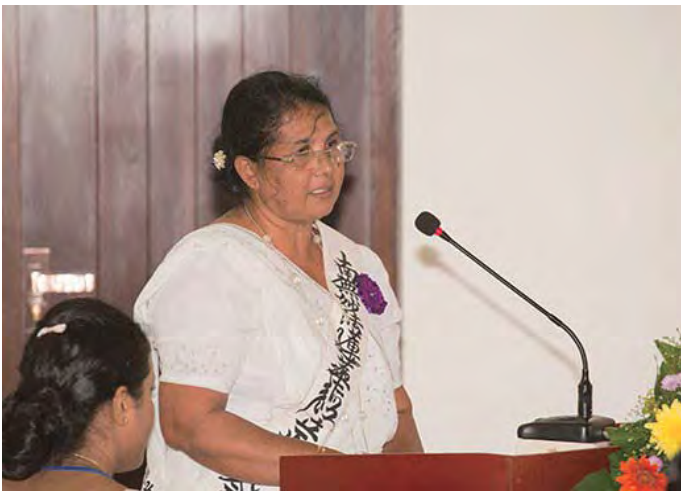
සෙප්පෝව ඉදිරිපත් කරන දයා මහත්මිය

පොලොන්නරුවේ දී ඉතා විශාල ව්‍යසනයකට මුහුණ දීමට අපට සිදු වුනා. එක් දිනක් සුපුරුදු පරිදි රැට කෑම කාලා නිදගෙන ඉන්න විට වැස්සකුත් සමඟම විශාල කුණාටුවක් ආවා. විශාල අඹ ගහක් ගෙයි වහලයත් කඩාගෙන ගේ තුලට වැටුනා. අපි දරුවන් රැගෙන ගෙයින් එළියට ආවත්, ඇවිද ගන්න බැරි තරමටම තද හුළඟ. දණ ගාගෙන ළඟ තිබුණ පාන් බේකරියකට ගොඩවැදුනා. අවට ගෙවල් වල 80 ක් වගේ පිරිසක් එතනට එකතු වූනා. අපේ ඇදුම් හොදටම තෙමිලා, කට්ටිය වැඩි නිසා ඉදගන්න වත් තැනක් නොමැතිව හිටගෙනම සිටියා. එළිය වැටීගෙන එන විට වැස්සත් පායන්නට වූනා. එත් අපේ ගේ හොයා ගන්න බැරි තරමටම හැම තැනම ගස් වැටිලා, ගෙවල් කැඩිලා, ඒවාට යටවෙලා මිනිස්සුන් මැරිලා. ලොකු විනාශයක් වෙලා තිබුණා.