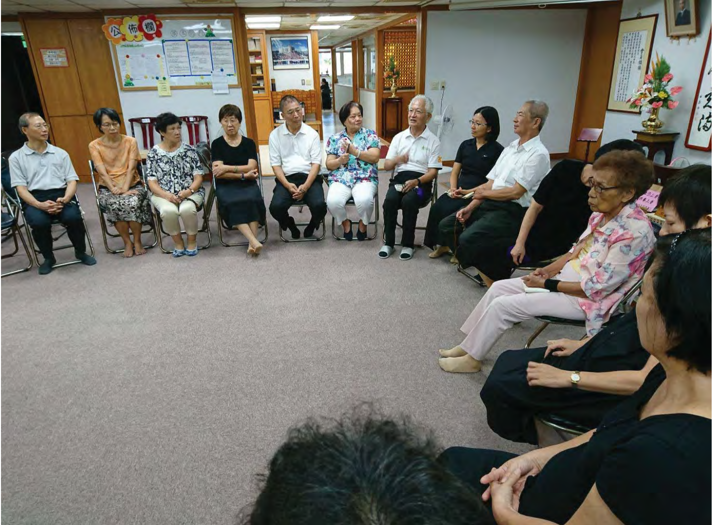
होजामा भाग लिदै चैनजी (बिचको)