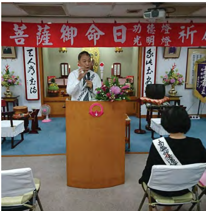
ताइपेइ मन्दिरमा प्रवचन गर्दै चैनजि

म नोवेम्बर ५ १९५०मा ताईवानको दक्षिणको पिङ्तुङ भन्ने सानो शहरमा ५ दाजु भाइको जेठो भएर जन्मिएको हु । हामी गरीब थियौ र कृषक बुवाआमा बिहानदेखी बेलुकसम्म दुख नमानी काम गर्नुहुन्थ्यो । जेठो छोरा म ८ वर्षदेखी बुवाआमालाई सघाउछु भनेर दाउरा बालेर भात पकाउथे ९ वर्षपछी तरकारी पनि पकाउन थाले । र बुवाआमा घर फर्किनुअघी खाना पकाउने तयारी गर्थे । तेस्पछी काम गर्दै कलेज जान थाले ।