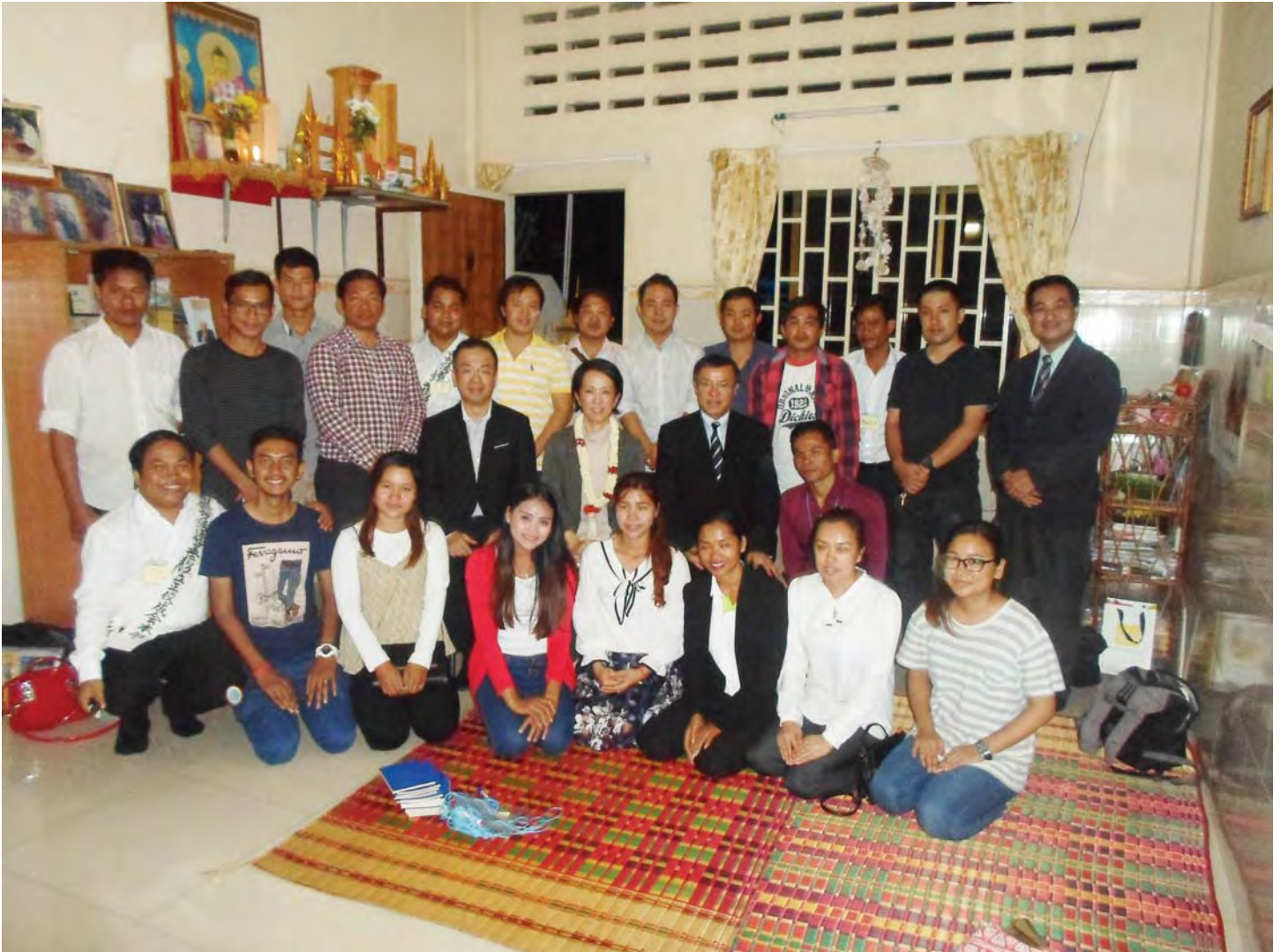
२०१६मा बुद्धगया होजा सुभारम्भ समारोह

यो वर्ष हाम्रो संस्था स्थापित भएको ८० वर्ष भएको छ । अध्यक्षले नयाँ वर्षको होजामा भन्नुभएको जस्तै यो संस्थाको जग बसाल्ने संस्थापक र सह-संस्थापक र अग्रजले सबै शक्ति लगाएकोमा आभारी भएर र निर्माणिकरूपमा भक्ती फैलाउदै, जापानका सबै जस्तै हास्ने खुशी हुने दयालु संघ दक्षिण एसियामा फैलाउदै जानेछौ ।