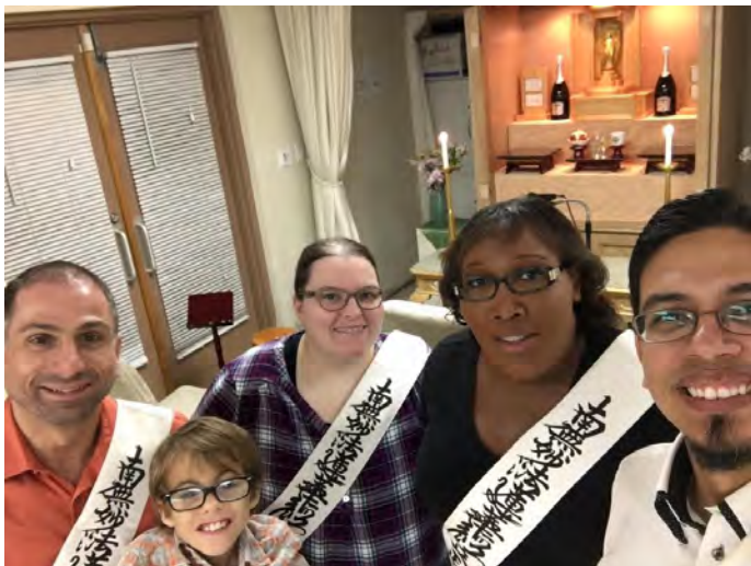
Фэйн гишүүн (баруун талаас хоёр дахь) Тампа-Бэй салбар дээр хоозад оролцож байгаа нь.

Би хорин хэдэн настайдаа хөрш айлын Ислам шашинтай эмэгтэйгээс анх оюун санааны шашинлаг зүйлийг мэдэрсэн юм. Одоо болтол би түүнийг тэр эмэгтэйгээс авсан “бэлэг” гэж боддог. Тэр эмэгтэй Аллахын сургаалд итгэдэг болохоосоо өмнө олон шашны талаар судалж байсан гэсэн. Мөн “Өөрийнхөө явах зам мөрийг хайн олж, агуу хүчтэй холбогдох хэрэгтэй” гэж хэлсэн. Тэгээд тэр хүчтэй холбогдох юм бол тэр хүчийг “өөрийнхөөрөө нэрлэхэд болно” гэж хэлсэн. Би тэр хүчийг “Ертөнцийг амьдруулах хүч” гэж нэрлэхээр шийдсэн юм.