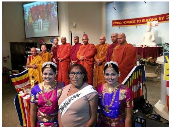
Фэйн гишүүн (дунд тал) үйл ажиллагаанд оролцож байгаа нь, 2015 он

Би гишүүн болсноор сургаалын ачаар маш амар амгалан болсон. Гэхдээ энэ бол зөвхөн эхлэл юм. Бурхан цаашид намайг ямар зүйлтэй учруулахыг тэсэн ядан хүлээж байна. Би эхлээд “өөрийнхөө зовлонтой өөрөө тулах хэрэгтэй” гэдгийг ойлгосон. Одоо бол “зовлонг хэрхэн шинэ учрал болгон өөрчлөх” талаар суралцаж байна. Олон зүйлийг ойлгосон маань Бурханы жинхэнэ нигүүлсэхүйн ач гэж бодож байна. Өнөөдрийг хүртэлх Бурханы бүхий л нигүүлсэхүйд талархаж, Бурханы дараагийн учруулах зүйл ямар ч зүйл байсан хүлээж авч чадна гэдэгтээ итгэлтэй байна. Баярлалаа.