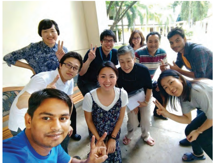
२०१७ युवा लिडर तालिममा सहभागीहरूसँग(पहिलो पंक्ति सबैभन्दा देब्रे

बुद्ध, संस्थापक र अध्यक्ष निवानो धेरै धन्यवाद । सबैजना धेरै धन्यवाद ।