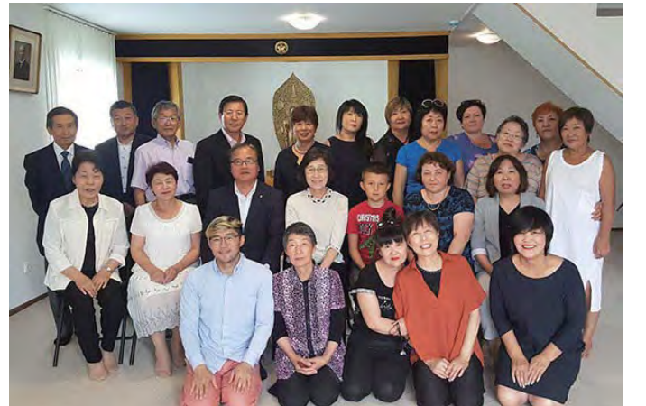
होक्काइदो शाखामा साहारिन संघको साथमा (अघिल्लो पंक्ती बिच)