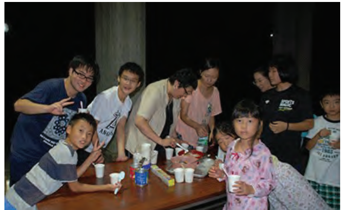
युवा क्यांपमा भाग लिदै उमेजुजि (पछिल्लो पंक्ति पहिलो)