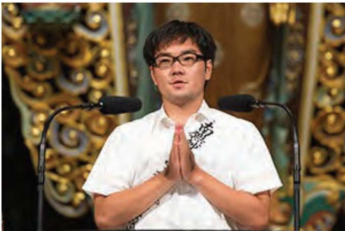
दाइसेइदोमा प्रवचन गर्दै उमेजु जि

अहिलेसम्म केहि नभएको आमालाई पोहोर साल जाडो महिनादेखी उहाको स्वोर धोत्रो हुनथल्यो र हामीले जचाउन गयौं । उहाको श्वास नलिमा फोको आएको रहेछ र स्वर