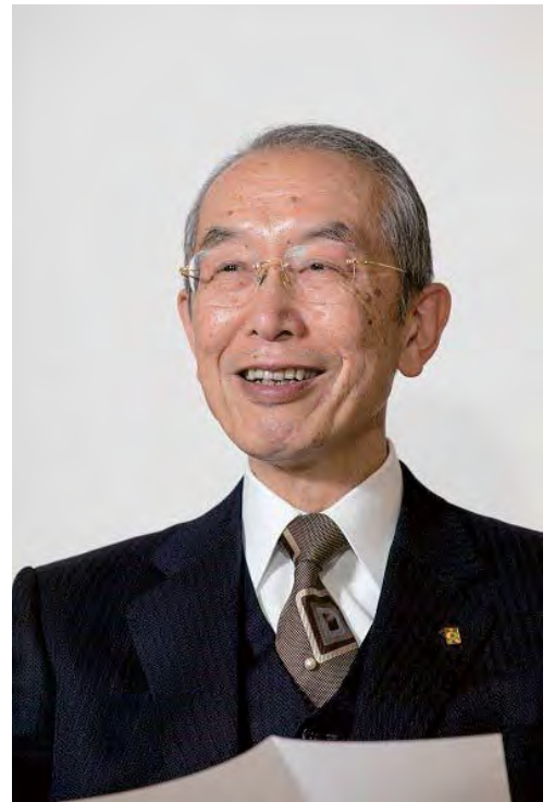
입정교성회 회장 니와노 니치코 (庭野日鑛)