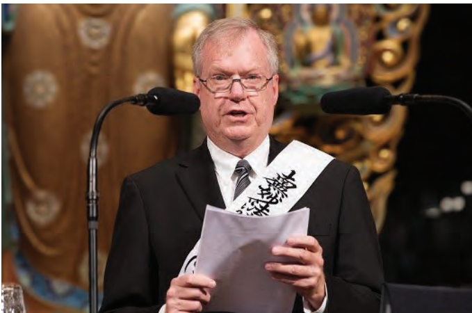
दाइसेइदोमा प्रवचन गर्दै रोजजि

म जवान हुँदा मलाई के चाहिन्छ थाहा थियो । हाई स्कुल