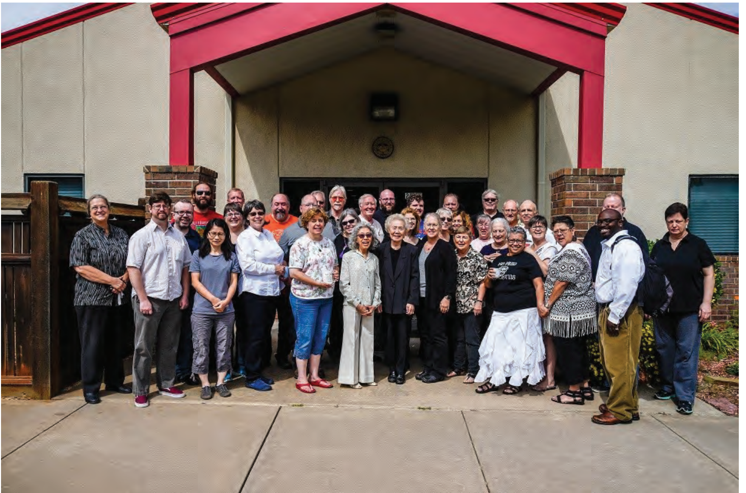
धर्मसेण्टरको प्रशिक्षणमा ओक्लाहोमा धर्मसेण्टरका साथीहरूसँग