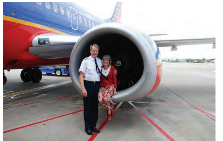
साउथवेस्ट वायुसेवाबाट अबकासपछी ज्यानसँग

२००९मा मैले कामबाट अबकास लिए र फुर्सतको समय घरमा बिताउन थाले । ज्यानको क्यान्सर त निको भयो तर सरिरमा धेरै चुनौती थिए । अबकास लिएको भएर मलाई रेवरेन्डले आधारभुत बुद्धधर्मको कुरा धर्मसेन्टरमा सिकाउनु भनेर भन्नुभयो । यो सुखद कुरा अहिलेसम्म पनि चलेको छ । मैले कती बुझ्न बाकी रहेछ र आफुले सिकेको कुरा अरुलाई सिकाउन कती गाह्रो हुदो रहेछ भनेर अचम्म परे ।