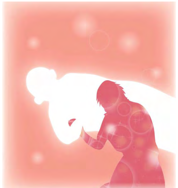
маш том аврал буян юм.

Ингэж ухаарч чадвал болчимгүй үйлдэл хийж чадахгүй болно. Төөрөгдөл хэмээх сэтгэлийн гэм үүссэн ч бай, түүнд захирагдан, алдаж, зовж шаналах зүйл байхгүй болно. Шуналын сэтгэл төрсөн ч цаанаасаа л сайн зүг лүү чиглүүлэн ашиглах болно. Энэ нь өөрөө