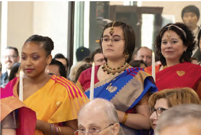
पुजा दिपज्योती गर्दै तोरेसजि

म बुद्ध, संस्थापक निवानो, अध्यक्ष निवानो, प्यारा संघप्रती धेरै आभारी छु । धेरै धन्यवाद ।