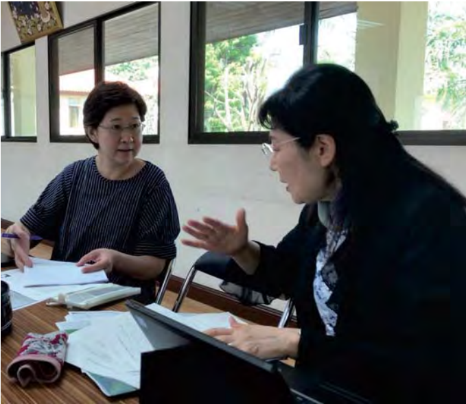
बैंकक मन्दिरमा गृह शिक्षाको बारेमा छलफल गर्दै मयुरिजि