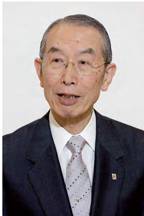
Рисшо Косей Кай, Ерөнхийлөгч Нивано Ничикоо