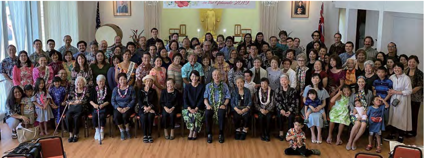
मार्चमा गरिएको ६०औं वार्षिक उत्सवमा हवाइ मन्दिरका सदस्यहरु