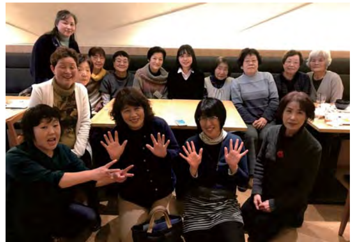
शाखाको बिदाइ कार्यक्रममा