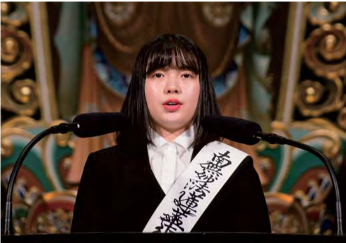
दाइसेइदोमा प्रवचन गर्दै नकागावाजिजि

शाखा प्रमुखसँगको छलफलमा मैले “के कस्तो कारणले गर्दा कोसेइ काइको शिक्षा लिनु भएको ?” भनेर सोध्ने आँट आयो । अनि उहाले आफ्नो जिन्दगी र धर्मसँगको भेट आदी कुरा गर्नु भयो । कुरा सुन्दै जादा म पनि खुल्ल थाले । अनि उहाले मलाई सधै दयाको दृष्टिले हेर्नु भएको रहेछ भनेर बुझी मन चङ्गा भयो र मेरो शाखा प्रमुखप्रतिको दृष्टिकोण १८० डिग्री परिवर्तन भयो । भोलिपल्टदेखी होजामा जाने मन अहिलेभन्दा धेरै परिवर्तन भयो । समस्या सुनेर उनिहरुलाई मुक्ती मिलोस भनेर सोच्ने थाले । बुद्धत्व पुज्ने मनले जो सुकैको प्राण पनि अमूल्य हो भनेर सोचन थाले । एक जनाको समस्या सुन्दा उहाको तारिफ गर्न सके । उहाले “बिचलित भएको मन चङ्गा भयो धन्यवाद” भनेर हसिलो अनुहार