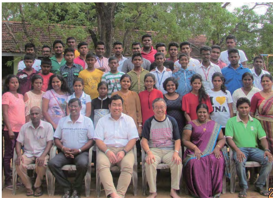
Hội thảo dành cho giới trẻ được tổ chức tại Đền Sri Lanka năm 2017.

Đức Phật, Đức Khai Tổ, thầy chủ tịch, Đức Phó Tổ, trưởng giáo hội Wakiya và tất cả các bạn, tôi xin thật sự biết ơn vì đã nhận được một cuộc đời tuyệt vời như thế này.