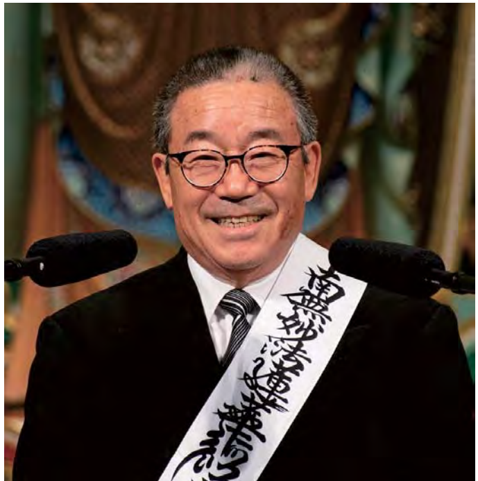
ජපානයේ, දයිසෙයිදෝවේදී සෙප්පෝව ඉදිරිපත් කරන යමමොතෝ ශාඛා ප්‍රධානී තුමා

ඒ ආකාරයට අවුරුදු 26 වූ මම, 'දෙමව්පියන්ට ස්තූතිවන්තවීම ගැන ඉගෙන ගෙන, තාත්තා සමඟ මින් ඉදිරියට හොඳින් කටයුතු කිරීමට ආත්ම විශ්වාසයක් ඇතිව, ගෙදරට යාමට කියොකයිචෝ සාන්ගෙන් අවසර පැතුවා'. එවිට, වකියා කියොකයිචෝ සාන්, 'මුලස්ථානයේ ගකුරින් යැයි පාසලක් තිබෙනවා එයට ඇතුළුවීමට විභාගය ලියන්න' යැයි කීවා. කෝසෙයි සංවිධානයේ ඉගැන්වීම් ඉගෙන ගැනීමට ගකුරින් පාසලට යන විභාගය ලිව්වා වුනත්, සමත්වීමට හැකි වුනේ නැහැ. 'තව පාරක් උත්සහ කර බලන්න' යැයි වකියා කියෝකයිචෝ සාන් කියා සිටියා. මම වගේ කෙනෙකුට පාස් වෙන්න බැහැනේ යැයි සිතමින්, අවුරුදු 3 ක් නොමිලයේ ආහාරපාන ලබාදුන් නිසා