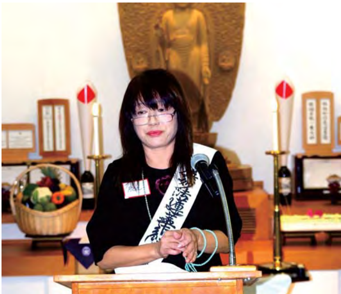
सान फ्रान्सिस्को मन्दिरमा प्रवचन गर्दै कायाजि

म धेरै खुशी थिए । दुइ छोरी पनि भए र हामीले घर पनि किन्यौ । सपनाको जस्तो संसार थियो ।