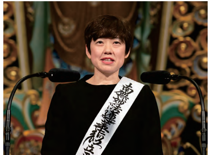
दाइसेइदोमा प्रवचन गर्दै कात्सुमोतो जि

छोराछोरीको हेरचार गर्नु पर्नाले दुख मनाउने समय नबित्दै आमाको बरखी सक्कियो । तेस्को एकमहिनपछी बुवालाई दिमागमा रक्त्साव भयो । सबैको हेरचार गर्न परेकोले दिदिन तनाव हुन्थ्यो तेसले गर्दै मलाई मानसिक रोग समेत भयो । तेहिबेलामा मन्दिरको प्रमुख तेदोरी गरेर साह्यता गर्न आउनुभयो ।