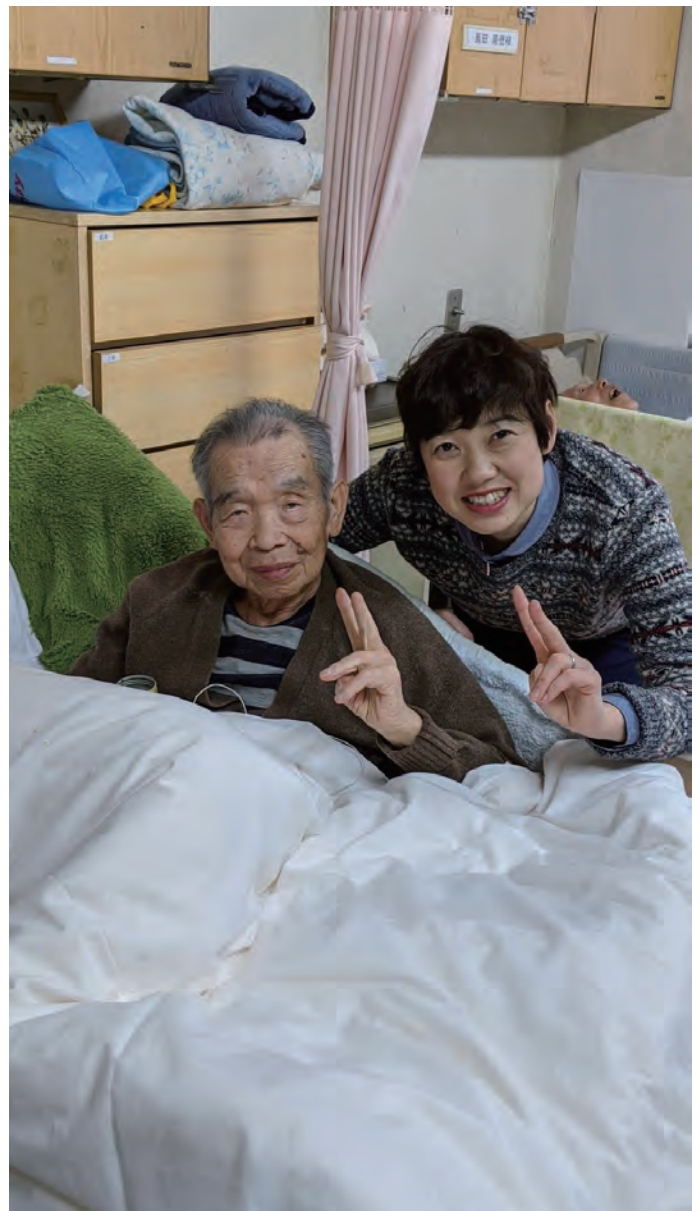
Với người cha của bà