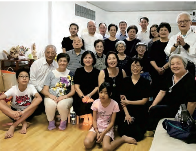
गोहोन्जो प्रतिस्थापन गर्दा चिनजी (सबैभन्दाअघी दाइनेबाट दोस्रो)

यो सुन्दर मौका दिनु भएकोमा धेरै धन्यवाद छ ।