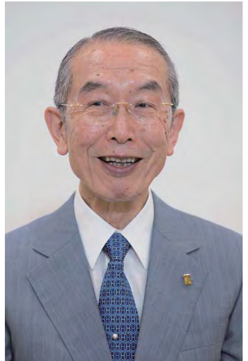
Nichikô NIWANO Président de la Risshô Kôsei-kai