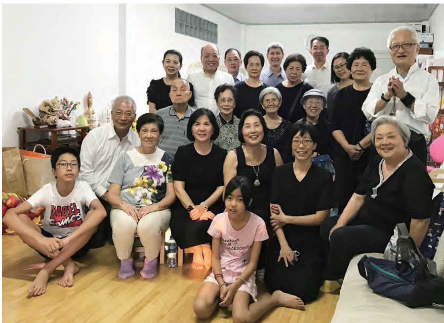
御本尊的安座儀式(最前排右方第二)