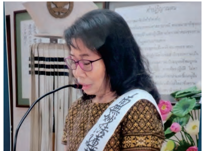
बैंकक मन्दिरमा प्रवचन गर्दै पृमजी ।

तेस्पछी सहकर्मीले मलाई मन पराउन थाले । कामको वातावरण पनि राम्रो हुन थाल्यो । मैले पनि काममा नरम बचन बोल्न थाले । सधै सहकर्मीहरुले के सोचेका छन भनी बुझ्ने अनि उनिहरुको मन बुझ्ने कोसिस गर्नाले मेरो जिवन परिवर्तित भयो । एक ग्राहकले मेरो परिवर्तन देखेर मलाई