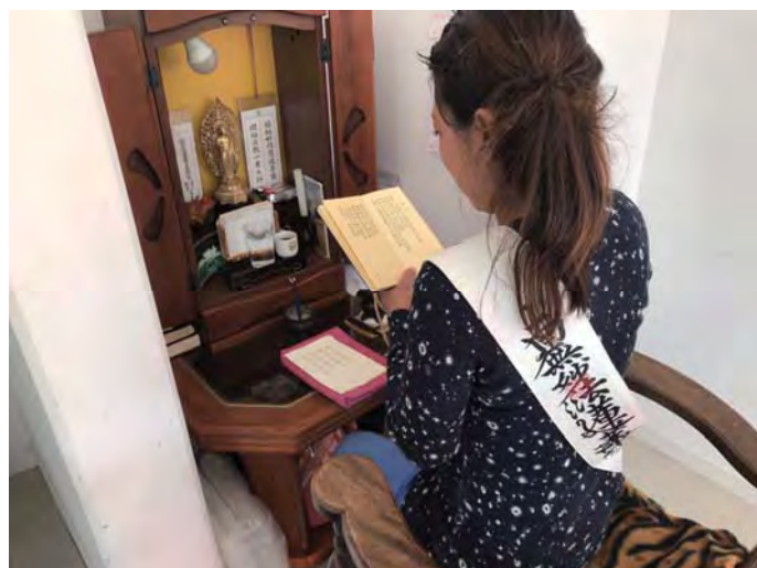
讀誦供養的悠起子女士