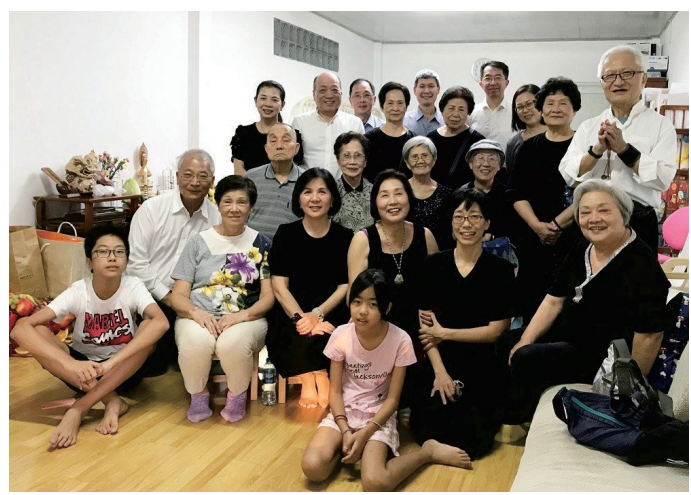
වෙන් මහත්මියගේ නිවසේ බුදු පිළිමය තැන්පත් කිරීමේ උත්සවයේදී

අද දින මේ අවස්ථාව ලබාදුන්නට හදවතින්ම ස්තූතිවන්ත වනවා. සියළුදෙනාටම බොහොම ස්තූතියි.