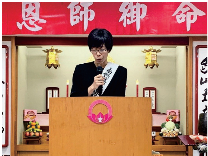
කායිවාන උතුරු ශාඛාවේදී සෙප්පෝව ඉදිරිපත් කරන වෙන් මහත්මිය

ජපානයට නැවත් පැමිණීම මම, බුදු දහම ඉගෙන් ගන්න ඕනා, ඒ වාගේම කෝසෙයි කායි ඉගැන්වීම්ද ඉගෙන ගන්න ඕනා යන හැඟීමෙන් සිටියා. එතෙක් උදසින්ව තිබූ මගේ විශ්වාසය, හදවතින්ම දහම අවබෝධ කරගන්න ඕනා යන ප්‍රායෝගික ධර්ම පුහුණුවකට වෙනස් වුණා. ඉන් පසු තරුණ කණ්ඩායමේ වැඩසටහන් වලට ක්‍රියාකාරීව සහභාගී වෙමින්