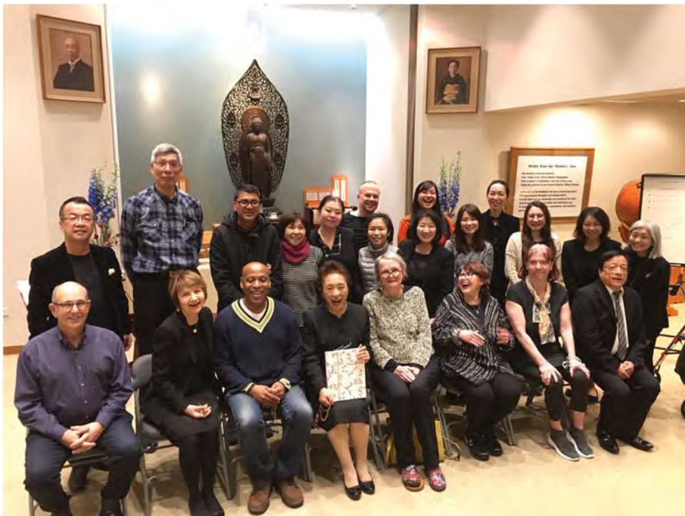
Với mọi người ở Giáo hội New York (thứ 4 từ trái sang hàng sau)

Hôm nay tôi xin cảm ơn tất cả mọi người đã dành thời gian lắng nghe ạ.