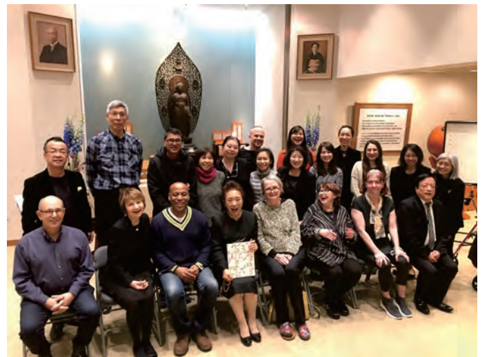
(पछिल्लो देब्रेबाट चौथो)