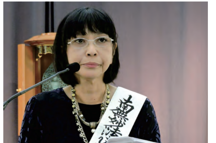
न्युयोर्कमा प्रवचन गर्दै नाइतोजि

म २० वर्ष हुँदा आमाले “कफि पसल खोल्नु अनि मलाई