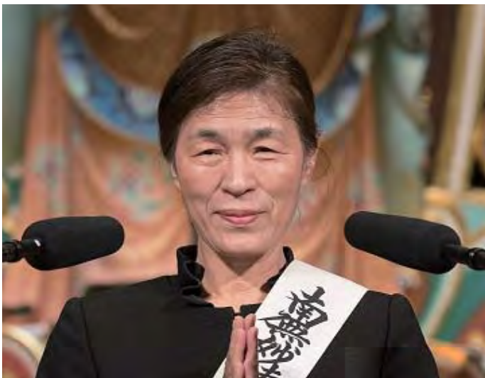
在大聖堂做體驗說法的成女士

第一次來到韓國立正佼成會的1995年7月15日，成為了我的第二個生日。「自己改變了，對方就會改變。」那就是當時聽到的說法的內容。對於想改變自己以外的所有事物的我來說，在教會中第一次聽