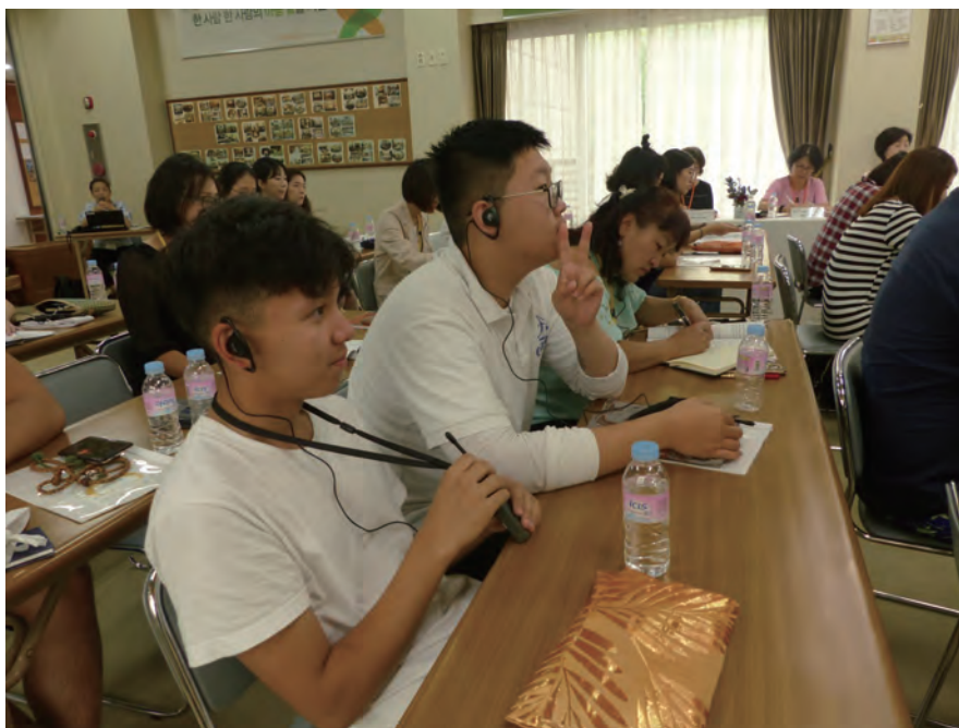
參加研習的巴亞魯先生