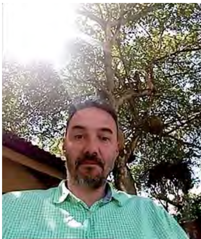
Г-н Моралес, принимающий участие в онлайн деятельности.

По пути домой я вспоминал этот день и подробно анализировал свои чувства. В тот день я пришел в уныние оттого что меня никто не поздравил с днём рождения. Однако,