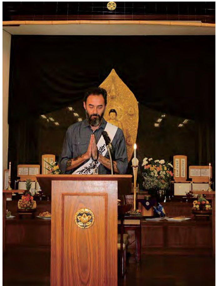
බ්‍රසීල ශාඛාවේදී සෙප්පෝව පවත්වන මොරාලෙස් සාන්

සාමාජිකයන්ගෙන්, යථාර්තවාදීව සෑම දෙයක්ම පිළිගැනෙන කටයුතු කිරීමට ඉගෙන ගන්න අතරතුර, මමත් එය ඵ්දිනෙදා ජීවිතය තුළ පුරුදු පුහුණු කර, අන් අයගේ වචනය සහ ක්‍රියාව විවේචනය නොකර, අන් අයගේ හැඟීම් වටහා ගැනීමට හැකි පුද්ගලයෙකු බවට පත් වීමට සිතා ගත්තා. ඇත්ත වශයෙන්ම, සෑම විටම ඒ ආකාරයට කරන්න බැහැ. තවමත් මාව අපහසුතාවයට පත්කරන