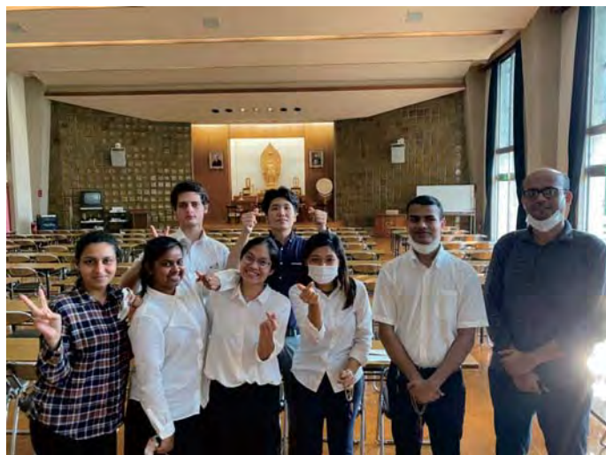
與學林海外修養科生的夥伴們（右邊第2位）

會長先生在法話之中教導「世間所有事情，都會成為回到『真正的自己』體味幸福的提示和緣」。回顧與前輩的關係，包含痛苦的事，任何的現像都是為了自己的成長都是有必要的，發覺到「沒有任何事物是多餘的」。讓我再次的意識