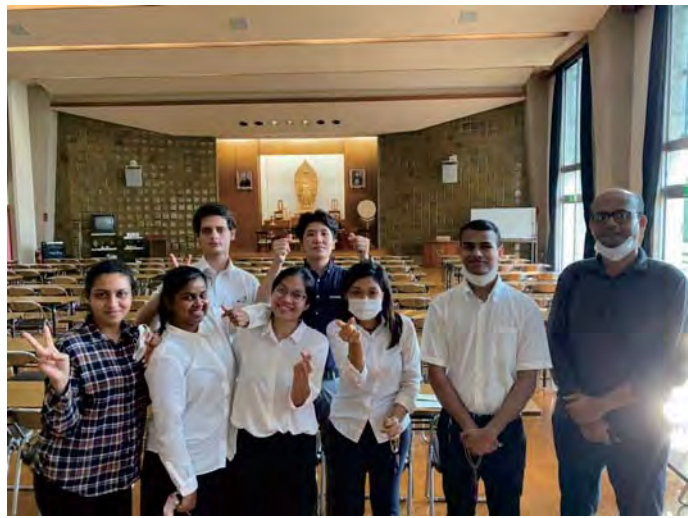
ගකුරින් හි සහෝදර ශිෂ්‍යයන් සමඟ (දකුණු පැත්තේ සිට දෙවෙනියට)

මා සමග එකම කාමරයේ සිටින මාගේ කණිෂ්ඨයාට ගකුරින් නේවාසිකාගාරයේ තිබෙන නීති රීති කියාදෙන ගමන්, වසරකට පෙර මම ගැන සිතා බැලුවා. ගකුරින් පාසලට ඇතුලත් වූ මුල් කාලයේ මම දැන් මා ඉදිරියේ සිටින මාගේ කණිෂ්ඨයා වාගේම, ජපන් භාෂාව හරි හැටි නොදැන, ජපන් සංස්කෘතිය දැන සිටියේ නැහැ. එම නිසා ජේෂ්ඨයාගේ බැණුම අහන අවස්ථා වැඩිවී ගකුරින් පාසල් ජීවිතය දුකක් වුනා. නමුත් මම කිහිප වතාවක්ම මාගේ ජේෂ්ඨයාගෙන් බැණුම් ඇසුවේ, ඔහු මා ගැන සිතමින් මාව ඉක්මනින්ම ජපන් ජීවිතයට හැඩ ගැසීමට මට උපකාර කරන්න, ඔහු දන්නාදේ මට කියාදීමට බව පළමු වතාවට මට අවබෝධකරගන්න හැකිවුනා. වසරකට පෙර මම, ජේෂ්ඨයා පිළිබඳ අකමැත්තෙන් මාගේ වර්ධනය ගැන සිතමින් ඔහු කියාදුන් දේ තේරුම් නොගෙන කටයුතු කලා. මා ඔහු ගැන සිතා සිටි වැරදි ආකාරය තේරුම් ගෙන ඔහුට හදවතින්ම