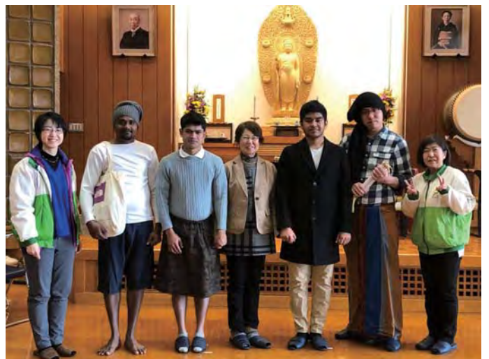
學林的講師與海外修養科生的同學們（左邊第2位）