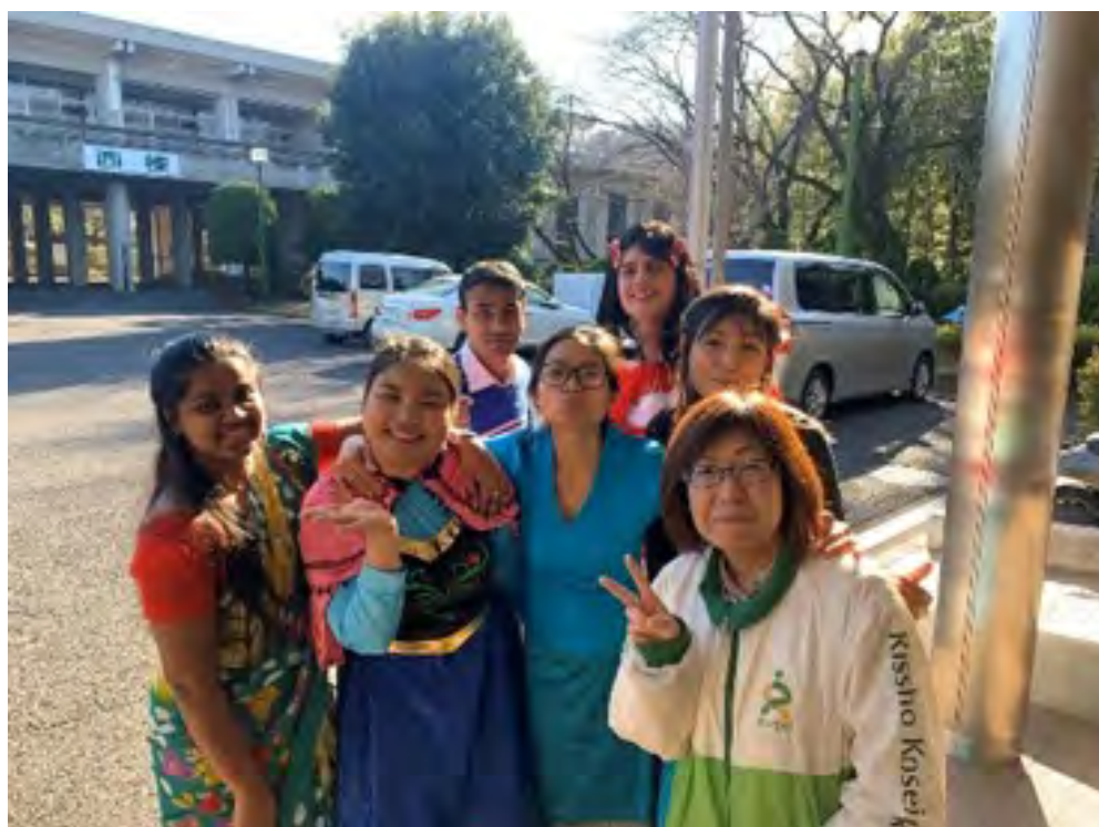
Người hướng dẫn và những người bạn thế hệ thứ 27 của Chủng viện Gakurin (giữa)

Tôi xin cảm ơn tất cả mọi người đã dành thời gian lắng nghe ạ.