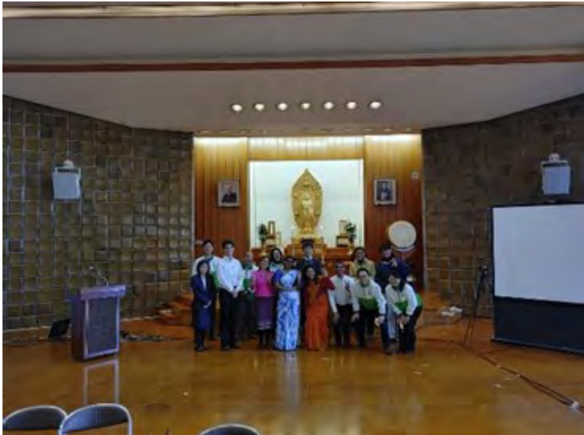
Sau buổi thuyết pháp tốt nghiệp (thứ ba từ trái sang hàng trước)

nay nhờ được rất nhiều người nâng đỡ hay mong muốn mới mẻ của bản thân mà chính tôi cũng không biết tới. Con người tôi trước khi vào học trường tăng lữ thì tôi nghĩ là giống như hễ có gì đó thì luôn khổ sở một mình, cố gắng một mình. Tôi từng bị người khác không hiểu được bản thân trong quá khứ và khi vào học trường tăng lữ, tôi đã không thể mở lòng với những người xung quanh. Cho dù muốn ở một mình nhưng trong cuộc sống ký túc xá thì không có chỗ như thế và chỗ mà có thể yên tâm chỉ là trong nhà vệ sinh. Các bạn tăng già đã rất lo lắng cho con người tôi như thế nên bắt chuyện với tôi rằng “Câu Su vẫn ổn đấy chứ?”. Mọi người đã không ngừng gõ cửa