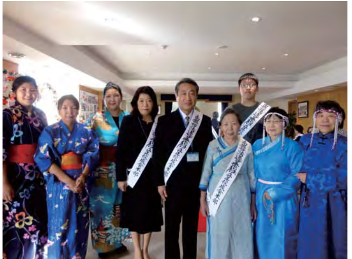
මොන්ගෝලියා ශාඛාවේ වාරිකාවක නිරත වූ අකගාවා මහතා (මෙගුරෝ ශාඛාවේ ප්‍රධානීව සිටින අවධියේ)