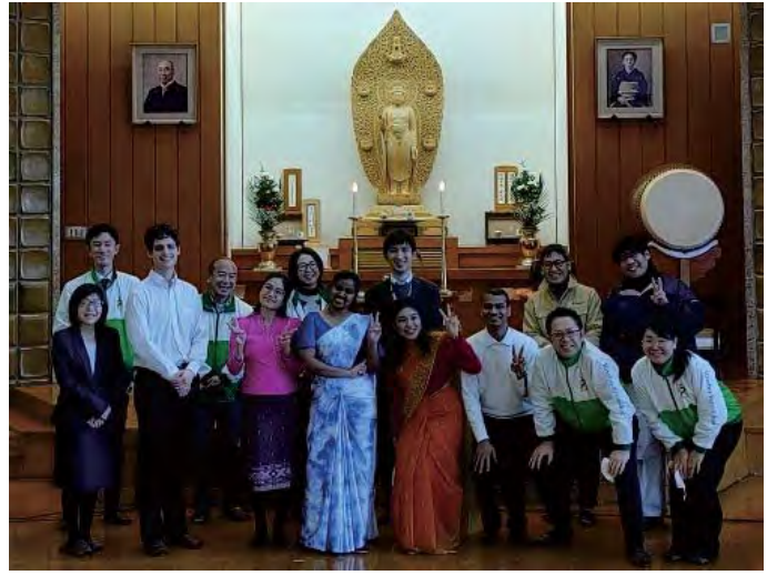
ගකුරින් හී පැවති සෙප්පෝව අවසන් විමෙන් පසුව (ඉදිරිපෙළ වම්පස සිට තුන් වැනියට සිටියි)

දෙවන කරුණ වනුයේ 'හෝසා කිරීමේ වැදගත්කම යි'. මගේ අන්දැකීම් අන් අය ඉදිරියේ කතා කිරීමට මැලිවූ නිසා මම හෝසාවට එච්චර දක්ෂ නැතැයි සිතුවා. ගිය වසරේ ඕමේ ධර්ම පුහුණු මධ්‍යස්ථානයේ පැවැත්වූ ධර්ම පුහුණුවේදී සිදුවූ සිද්ධියක් නම්, කාර්ය මණ්ඩලයේ ඔකුමුරා සාන්ගේ බිරිඳ වන මසයෝ සාන් අසනිපව රෝහල්ගත කර සිට, රෝහලෙන් පැමිණි විගසම අපේ ධර්ම පුහුණුවේ උදව්ට පැමිණ, හෝසාවටත් සහභාගි වුනා. නමුත් මම නිරෝගීව සිටියත් හෝසාවෙන් නැගිට යන්න ඕනා යන හැඟීමෙන් සිටියා. කෙසේ වෙතත් මම කතා කරන දෙයට මසයෝ සාන් හොඳින් ඇහුන්කන්දී සිටියා. එය දැක මට අඩවන්නට වුනා. ඒ අවස්ථාවේදී මට ජීවිතයේ පළමු වතාවට හෝසාවක තිබෙන්නාවූ වටිනාකම අවබෝධ වුනා. ගකුරින් පාසලේ යොමිකි ඔයිමි මහත්මිය 'ස්තූතිවන්ත හෝසාවක් කල විට බුදුන් වහන්සේ සකුටට පත් වන බව' පැවසුවා.