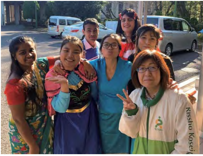
ගකුරින් පාසලේ ගුරුතුමිය හා එකම පන්තියේ ශිෂ්‍යයන් සමඟ (ඉදිරිපෙළ මැද සිටියි)