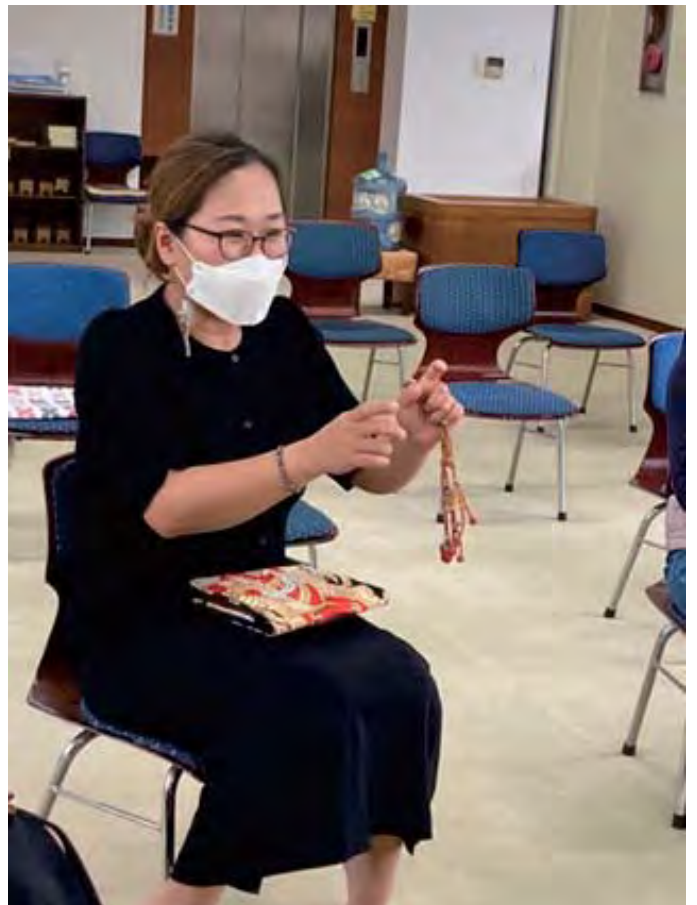
參加法座的朴女士