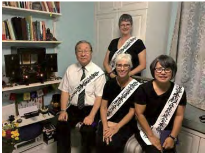
ෆෝරි මියර් ප්‍රදේශයේ බුද්ධ රූප තැන්පත් කිරීමකට සහභාගී වීම (දකුණු පැත්තේ)

නික්යෝ නිවානෝ තුමාගේ ධර්ම ඉගැන්වීම් අසා මම සෑම විටම විශ්මයට පත්වුනා. ඇමරිකන් ජාතික මාගේ සැමියා සමඟ විවාහ වීමෙන් පසු, 1978 වසරේදී මම ඇමරිකාවට ගිය දිනයේ සිට, නිවසේ සිට රිෂ්ෂෝ කෝසෙයිකායි ධර්ම ශාඛාව දුරින් පිහිටා තිබූ නිසා නිතරම ශාඛාවට යාමට නොහැකි නිසා, සෑම මසකම කියාදෙන නික්යෝ නිවානෝතුමාගේ ඉගැන්වීම් මගේ ජීවිතයේ මාර්ගෝපදේශ ලෙස පිළිපදිමින් කටයුතු කලා. නිවනෝතුමා ජීවිතක්ෂයට පත්වීමෙන් පසුවත් මම එතුමා රචනා කල පොත්, සඟරා ආදිය කියවීම සිදුකලා. එතුමාගේ ඉගැන්වීම් අතරින් මම වඩාත් විශ්මයට පත් වූ ඉගැන්වීම වනුයේ 'බුද්ධ