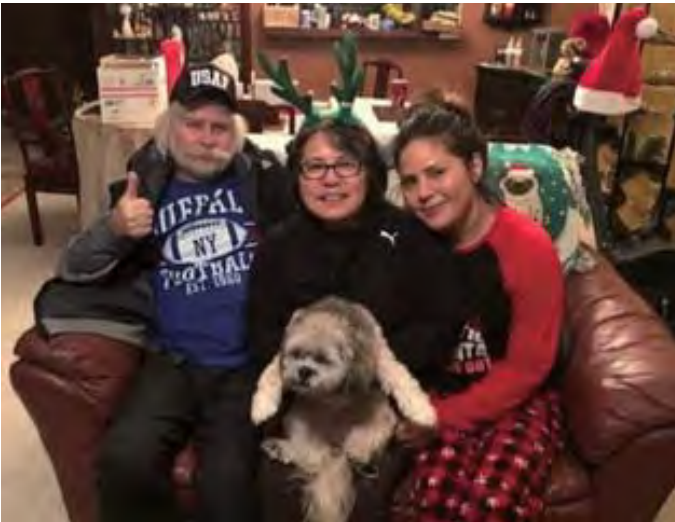
පවුලේ සාමාජිකයන් සමඟ (මැද)

ඒ වාගේම මාගේ තව වෙනස් වීමක් නම්, කිරීමට අපහසු අකමැති දේ වලටත් මුහුණ දීමට හැකි බවට පත් වුණා. මම සිතා සිටි දේ ඒ ආකාරයටම සිදු නොවේනම් මම දුකින් අසතුටින් කාලය ගතකලා. එවන් මම නික්යෝ නිවානෝ තුමාගේ ඉගැන්වීම් තුළින් ලොකු ශක්තියක් හා ප්‍රබෝධයක් ලැබුවා. 'අපි සෑම දෙනාම සාමාන්‍ය මිනිසුන්