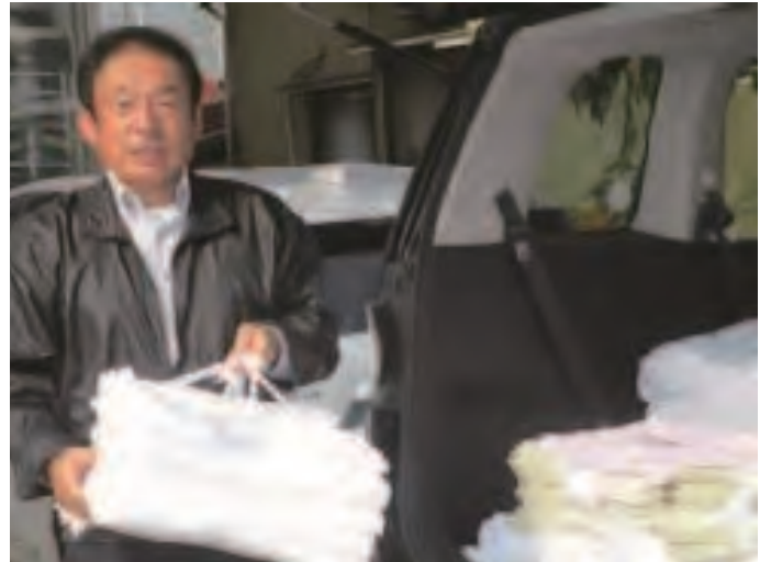
बनाएको कपडा ढुवानी गर्दै नाकायामाजी ।