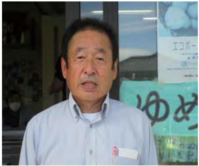
'හොකුරිකු රැස්වීමේ දී' තකමකා ධර්ම ශාඛාව භාරව කටයුතු කරන නකයමා සාන්.

එම උපදෙස් මට විශාල කම්පනයක් ගෙන දුන්නා. මමත් අනෙක් සේවකයන් වාගේම, ව්‍යාපාරය බිඳ වැටීම, සේවකයන්ගේ සමගිය සතුට නැතිවීම යන සෑම දෙයක්ම වුනේ ප්‍රධානීතුමාගේ වරදක් යැයි සිතා ඔහුට දොස් පරොස් කියමින් සිටියා. 'ප්‍රධානීතුමාට කරුණාවන්තව සලකමින්