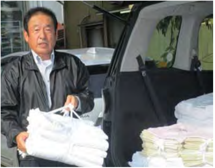
නිෂ්පාදිත ඇඳ ඇතිරිලි ගෙන එන නකයමා සාන්.

'ඔවුන් වෙත ගොස්, අපගෙන් වුන අපහසුතාවයට සමාවෙන්න.' යැයි හිස නමා සමාව අයැද සිටියා. ඒ සමගම ඔවුන්ට සිදු වූ අපහසුතාවය ගැනද විමසා බැලුවා. 'අපගේ නිෂ්පාදන නොලැබුණහොත් මහත් අපහසුතාවකට පත්වන බව' ඔවුන් පැවසූ දේ අසා එම ප්‍රදේශය තුළ තිබෙන වෙනත් සමාගමකින් ඔවුන්ට එම නිෂ්පාදන ලබාදීමට කටයුතු කලා. ඉන් පසු ඔවුන්ගෙන් පමිණිලි නොපැමිණියත්, ඒ වෙනුවට මාගේ ඉදිරිය ගැන සිතමින් මා ගැන කණගාටුවන කිහිපදෙනෙක් සිටියා. ඔවුන් අතරින් කිහිපදෙනෙක් 'ඔබ අළුත් සමාගමක් පටන් ගන්නානම්