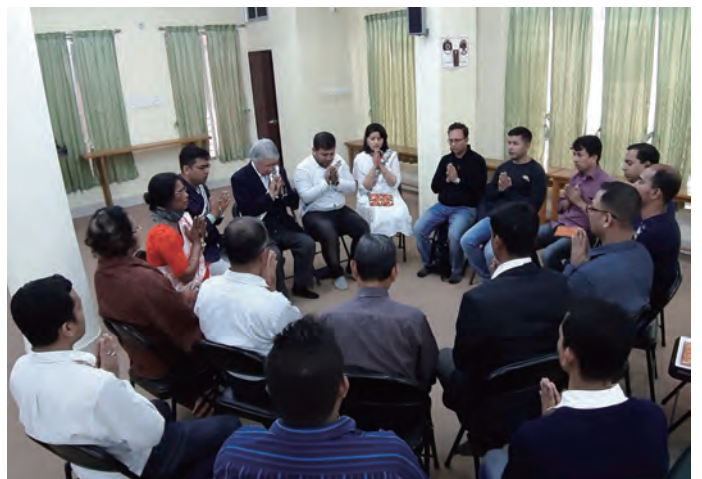
法座に参加するショプナさん(オレンジ色の服装の女性)

立正佼成会の教えは、伝統的な上座仏教とは異なり、私にはまったく新しい教えのように感じられました。何事にも感謝し、「まず人さま」と他の人を第一に考え、笑顔で丁寧に話をする。そうした教えに私は心を惹かれました。教会でご供養の後に行なわれる法座で