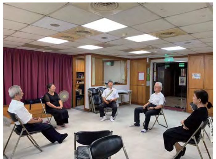
參加法座的杜女士