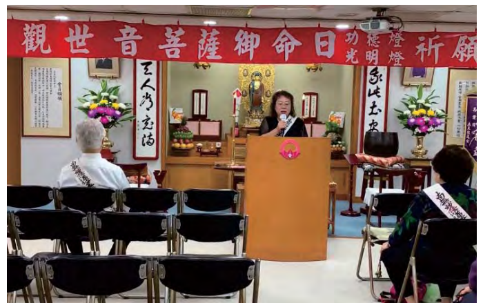
在臺北教會說教的杜女士

在4月7日準備隔天浴佛節的蔬果擺盤，從市場採買到佛堂擺飾完成時，其實心裡一直罣礙著家裡阿嬤的祖墳又出狀況（土地的紛爭），疑似921地震後，中心位置偏移，造成山上土地移位，牽扯部分墓地是別人的地，原本以為將阿嬤