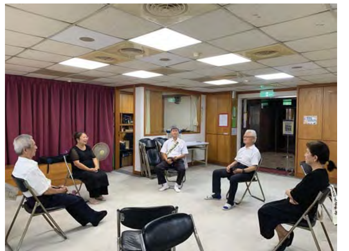
होजामा भाग लिदै डुजी ।