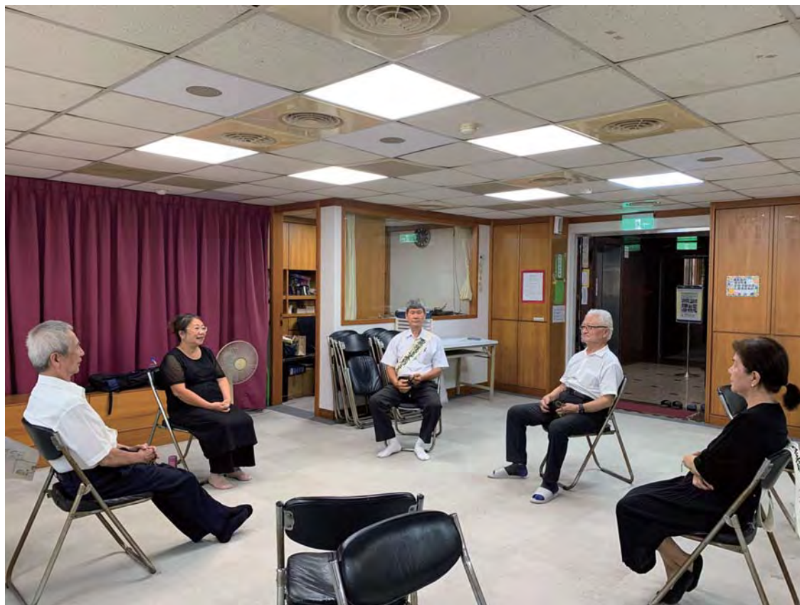
Г-жа Ду, участвующая в «ходза».