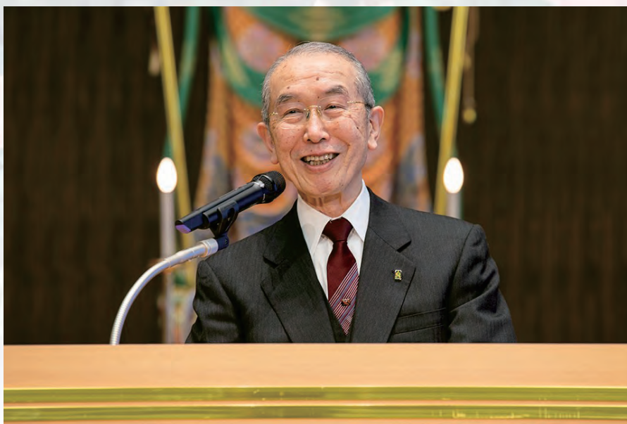
Поч. Ничико Нивано Претседател, Ришо Косеи-каи