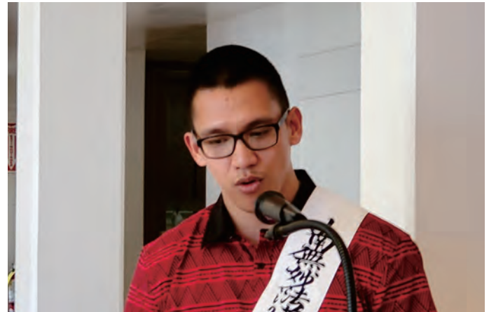
प्रवचन गर्दै क्रेजुगिजि

त्यो बेलामा मलाई जेल फर्के पनि केहि डर छैन भन्ने लागेको थियो र अपराध झनझन धेरै गर्दै गए । जेलको जिवनमा