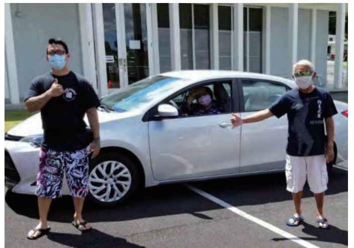
मन्दिरमा आउनेलाई जानकारी दिदै क्रेजुगिजि (निल मात्सुशिमाजिसँग)

आज मलाई यसरी बोल्न दिनु भएकोमा धन्यवाद ।