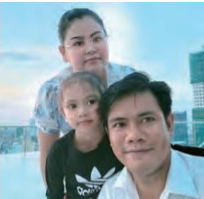
परिवारसँग (फुनन्पेनको आफ्नो अपार्टमेन्टको छतमा)

मेरो जिवनलाई धेरै परिवर्तन गरी दिएको “पहिला अरु” भन्ने उपदेश र यो उपदेश हामीलाई सुम्पनु भएको संस्थापकप्रती म हार्दिक आभार व्यक्त गर्दछु ।