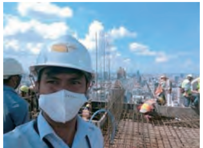
फुनम्पेन शहरमा अपार्टमेन्ट निरिक्षण गर्दै चम्रबजि

गृहयुद्ध सक्किएपछीको हाम्रो जिवन धेरै दुखी थियो । म १३ वर्ष हुँदा आफ्नो पढाई निरन्तर गर्ने फुनम्पेन नजिकको मन्दिरमा गएर त्यहाँ भिक्षु भएर स्कुल जान थाले । भिक्षु भएमा पढाईको